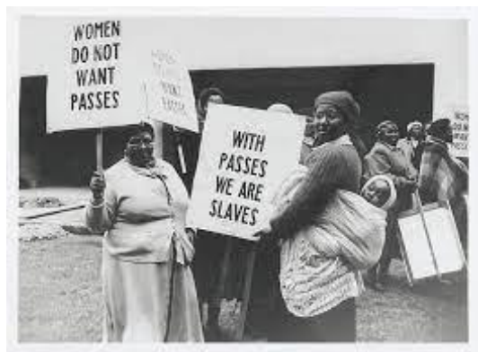
Imagem disponível no endereço eletrônico:

“Mulheres não precisam de passes” e “Com passes, nós somos escravas”.